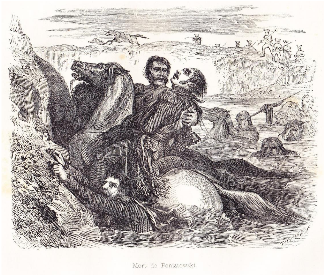
Mort de Poniatowski.

“Mort de Poniatowski” , illustration horizontale, hors texte